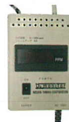
O2 モニター ※オプション