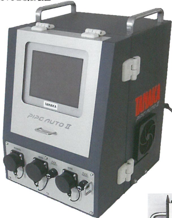
PIPEAUTO II 制御装置