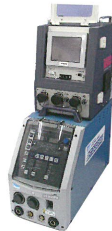
ダイヘン製 DT-300P II との接続例