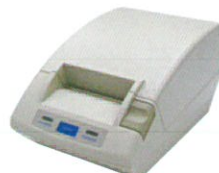
プリンター ※オプション