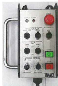
リモートペンダント