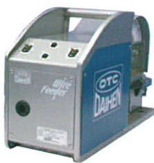
ダイヘン製 ワイヤ送給装置 (CM-7471) ※オプション