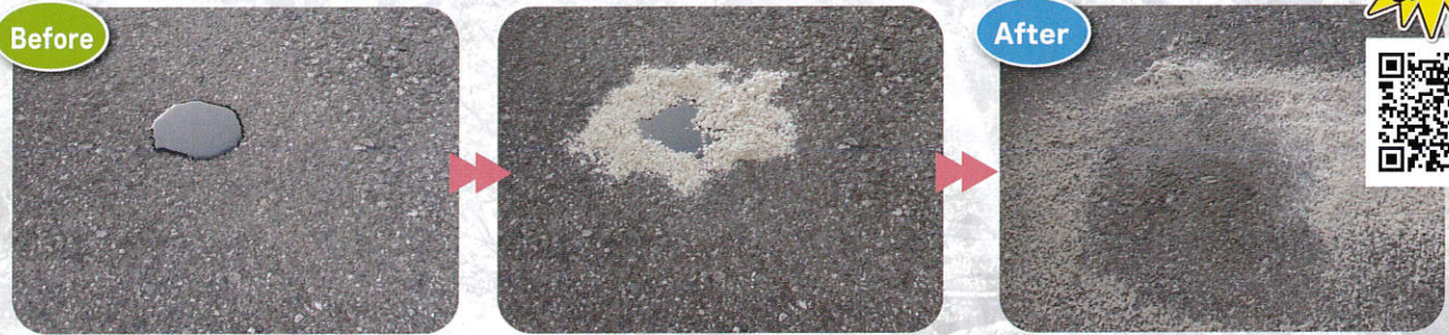
エンジンオイルの廃油