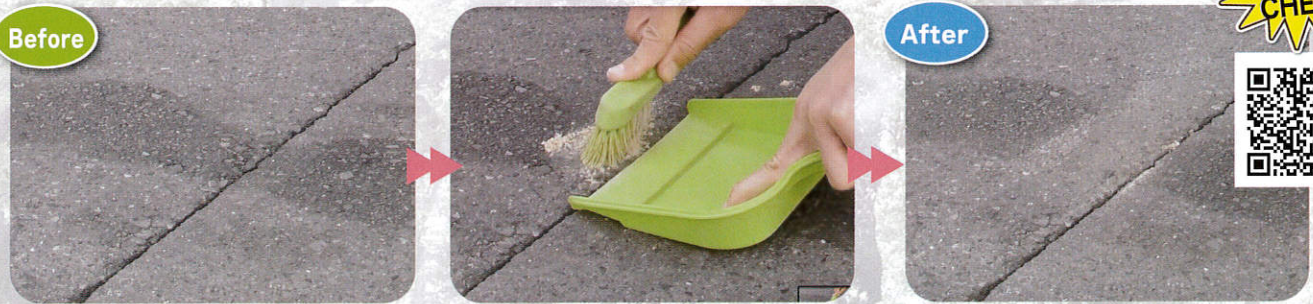
こぼれた乾燥オイルも…