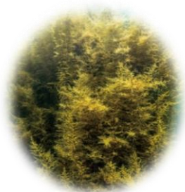
リムベールPD (クラドシホン/バエカレドニアエエキス)

フランスのブルターニュ地方の褐藻から抽出された成分です。強力な抗酸化作用をもつポリフェノールを大量に含み、輝く素肌へ導きます。