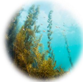
キリバースBG (カッパフィカサルパレジェクス)