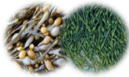
Algo White G (アルゴホワイトG)

淡水性単細胞緑藻類のクロレラ(Chlorella vulgaris)から抽出した水溶性エキスで、ペプチド、アミノ酸に富みます。真皮の弾力性を高めハリを与えます。