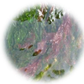
アルゲフィルマー (スサビノリエクス)

繁殖力の強いワカメの根本(メカブ)部分から抽出。乾燥による不快感の強い肌に潤いとなめらかさを与えます。