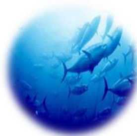
シージェムコラーゲン (サクシニルアテロコラーゲン)

キハダマグロの真皮から抽出したコラーゲン。サクシニル化によって、安定性が高く、保水性、弾力性、バリア機能にも優れた保湿成分です。