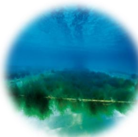
フコダイン (オキナワモズクエキス)

ミネラル豊富な海で自生するトンガ王国産天然モズクから抽出した高純度フコイダン。潤い、ハリのある健やかな肌へ導きます。