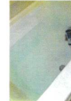
試験に使った浴槽