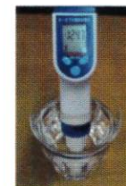
浴槽水を検水して測定