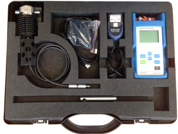
図 5: 型式2516B12