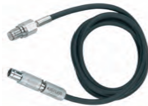
図 6: 圧力センサ 型式 6619AP35