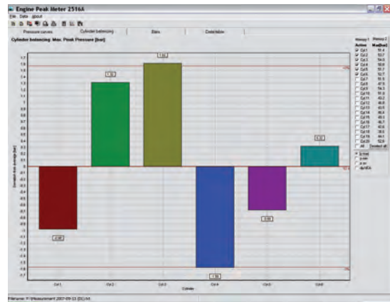
図 3: エンジンの平均ピーク圧計算値と比較した各シリンダのピーク圧偏差Pav、保守作業の前後 ("as found" / "as left")