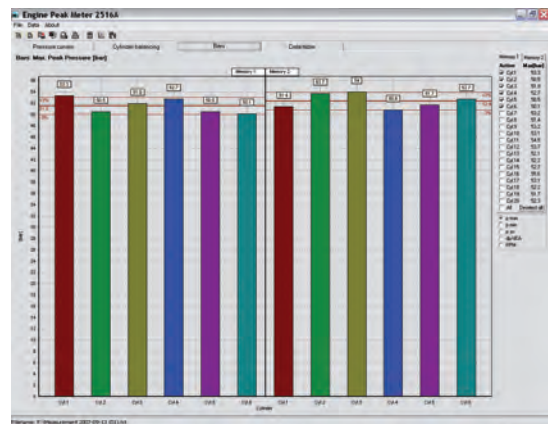
図 4: 圧力波形のズーム拡大